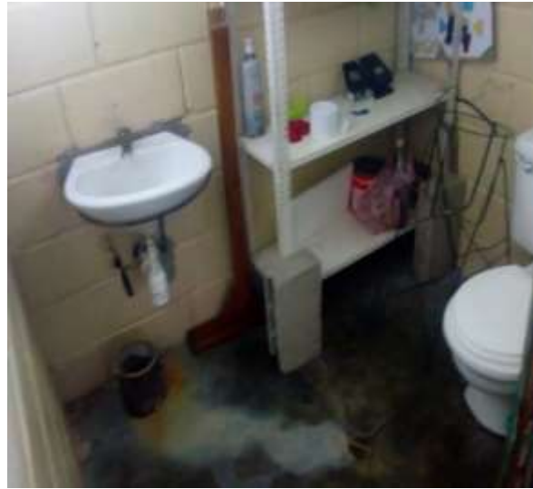
Estado actual de los baños y cocina