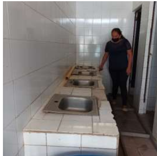
Estado actual de los baños