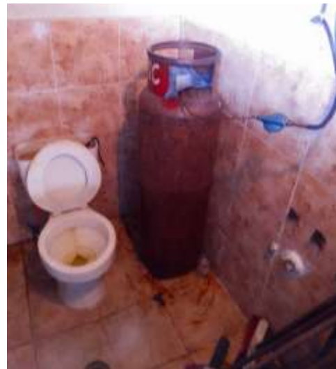
Estado actual de los baños