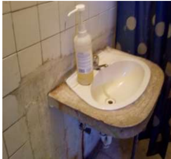
Estado actual de cocina y baños