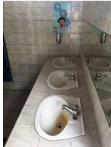
Estado actual de cocina y baños