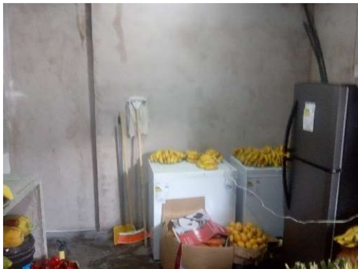
Estado actual de cocina