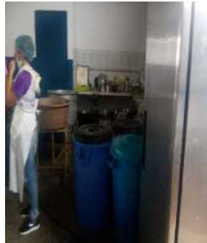
Estado actual de cocina y baños