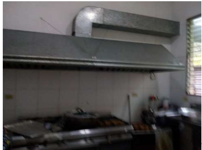
Estado actual de cocina